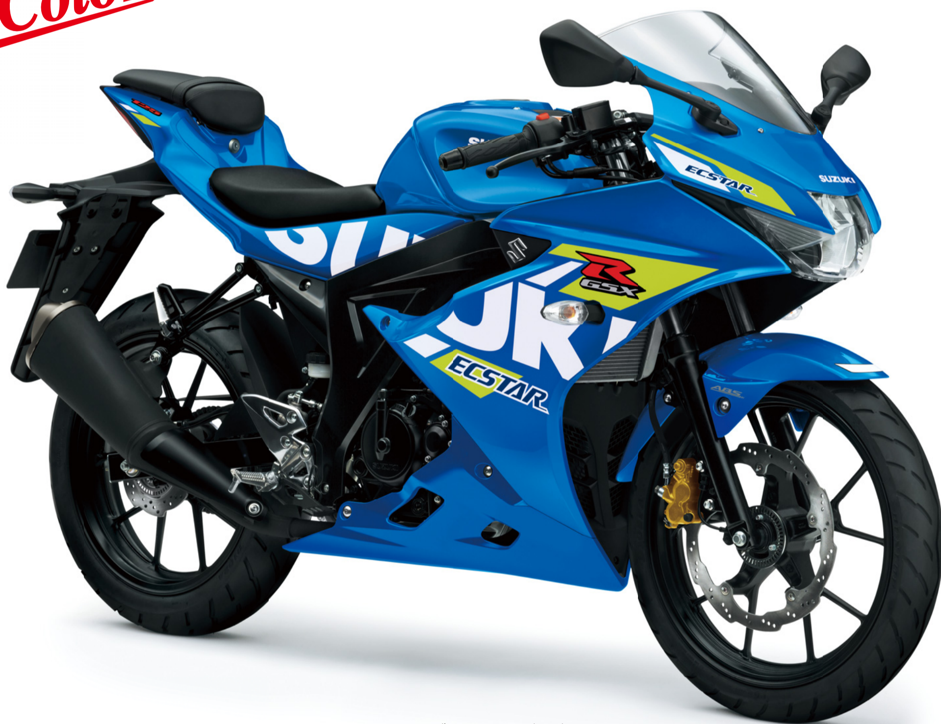
トリトンブルーメタリック (YSF)